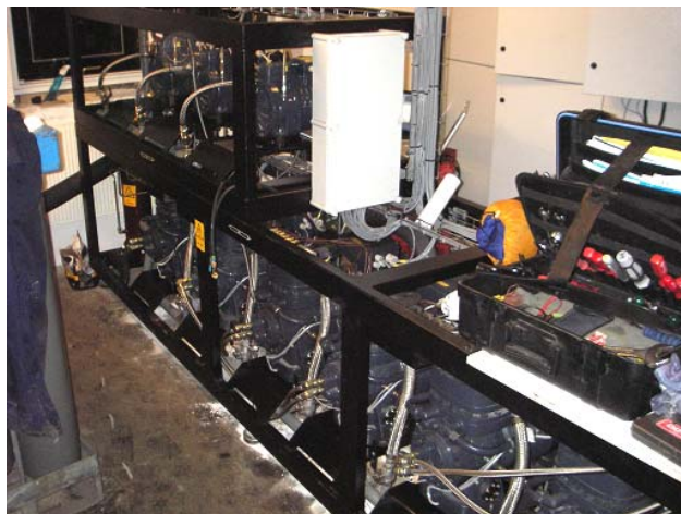
Køleaggregatet i kælder under opstart