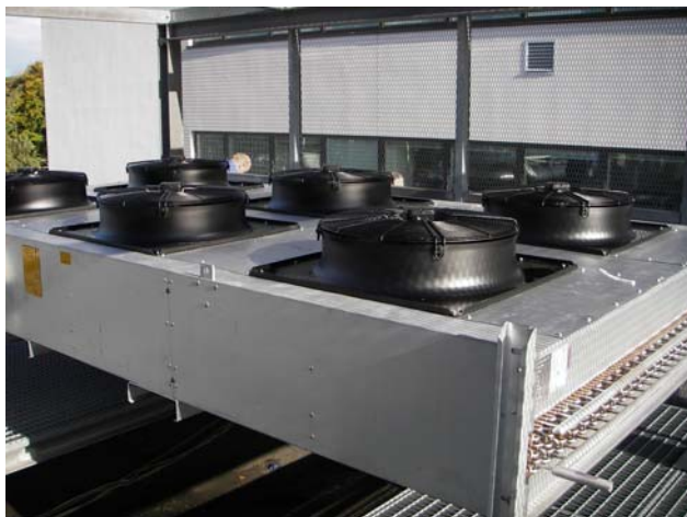
Den luftkølede kondensator/ gaskøler placeret på tag.

Anlægget anvender Danfoss ADAP-KOOL styringer til både møbler, kompressor-anlæg, højtryksstyring og kondensatorstyring.